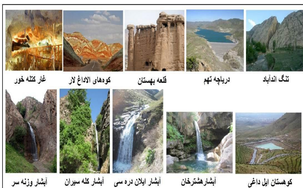
شکل ۲. نمونه‌ای از ژئوسایت‌های منطقه مورد مطالعه