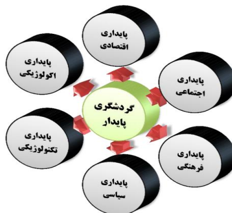
شکل ۱. پایداری در گردشگری شهری و ابعاد آن (چوی و سیراکایا، ۲۰۰۶؛ اویولا و همکاران، ۲۰۱۲)

امروزه مهم‌ترین رویکرد در حوزه گردشگری، متناسب با دیگر حوزه‌های توسعه و تحول در شهرها، توسعه پایدار آن است. مفهوم پایداری گردشگری برای اولین بار در دهه‌ی ۸۰ قرن بیستم مطرح شد. بنا به تعریف سازمان جهانی گردشگری توسعه پایدار گردشگری فرایندی است که با بهبود کیفیت زندگی میزبانان، تأمین تقاضای بازدیدکنندگان و به همان نسبت با حفاظت منابع طبیعی و انسانی در ارتباط باشد (امرالله‌ی بیوکی و نظری دهقی، ۱۳۹۴: ۱۰۶). از سوی دیگر مطابق مطالعات بانک جهانی برای تثبیت جایگاه گردشگری به‌عنوان زبان واحد توسعه در مرزهای دور، توجه به پایداری پیشران‌های سیاسی و فرهنگی به‌عنوان پیشران‌های کلیدی در رشد و شناسایی مقاصد گردشگری بسیار مؤثر است. در واقع، به اعتقاد محققان توجه به حوزه تحول‌آفرین گردشگری با یکپارچگی توجه و ممارست در پیشرفت پیشران‌ها و مؤلفه‌های تبیین‌کننده آن، اتخاذ تسهیلات سیاسی و با بهره‌گیری از توان تکنولوژی پیشرفته عصر حاضر امکان‌پذیر خواهد بود (اویولا و همکاران، ۲۰۱۲: ۶۶۲). شناسایی هویت بومی در قالب فرهنگ و تاریخ ملی؛ شناسایی و ارج نهادن به داشته‌های اجتماعی و طبیعی و توجه به رشد و تعالی اقتصادی از مهم‌ترین نکات توجه به پایداری در حوزه گردشگری ذکر شده است (باکلی، ۲۰۱۲: ۵۳۱). پیران‌ها و راهبردهای پیش‌برنده‌ای که به‌صورت زیرمجموعه یک سیستم، همدیگر را حمایت کرده و در پایداری سیستمی به نام گردشگری تأثیر به‌سزایی دارند.