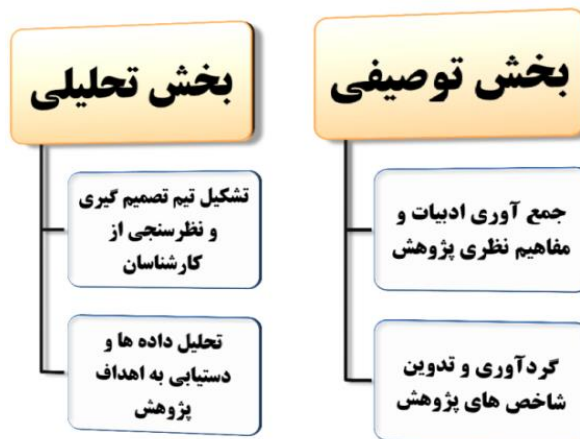
شکل ۲. فرایند اجرای پژوهش

مرتبط ۱ برای جمع‌بندی و تدوین نهایی نیز استفاده شد. این مرحله در دو راند انجام شد و برای محاسبه میزان اجماع کارشناسان از ضریب روایی کندال ۲ استفاده شد. در این مرحله پیشران‌ها و شاخص‌هایی مورد استناد قرار گرفتند که دارای ضریب کندال نهایی بالای ۰/۷ بودند. در مرحله بعد، به روش پیمایشی و با ابزار پرسش‌نامه از نظرات ۳۰ نفر از کارشناسان برای ارائه وزن و ارزش به این پیشران‌ها و شاخص‌ها با توجه به وضعیت موجود گردشگری شهری در شهر اهواز استفاده شد. در نهایت برای تحلیل داده‌های پژوهش متناسب با اهداف تعیین شده یعنی ارزیابی میزان اولویت پیشران‌ها و شاخص‌های پایداری گردشگری شهری در شهر اهواز از رهیافت شبکه عصبی پرسپترون چندلایه و ارزیابی میزان تأثیر پیشران‌ها و شاخص‌های پایداری در فرایند پایداری گردشگری شهری در شهر اهواز از مدل‌های رگرسیونی خطی، لگاریتمی و لجستیک استفاده گردید.