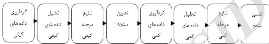
نمودار ۱- طرح پژوهش

در این پژوهش با کمک طرح اکتشافی، ابتدا داده‌های کیفی و سپس داده‌های کمی گردآوری می‌شوند.