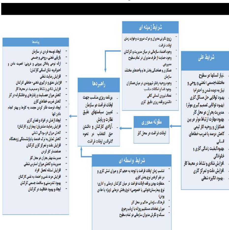
شکل ۱: الگوی پارادایمی مدیریت اوقات فراغت کارکنان در محیط کار

بر اساس نتایج بخش کیفی مدل کلی مدیریت اوقات فراغت کارکنان در محل کار در بیمارستان های منتخب شهر شیراز در شکل ۱ نشان داده شده است.