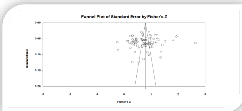
شکل ۱: نمودار قیفی تحقیقات اثر سبک رهبری بر اعتماد به رهبر در ۷۶ تحقیق منتخب

انتشار نیستند. اما هر چه مطالعات به سمت پایین قیف کشیده می‌شوند، خطای استاندارد آن‌ها بالا می‌رود و سوگیری انتشارشان افزایش می‌یابد (محمدی مقدم و عباس پور؛ ۱۳۹۳). نتایج بررسی سوگیری انتشار در این تحقیق در حالت سطح مورد پذیرش و خطای استاندارد در اشکال ۱ و ۲ نشان داده شده است که همچنان این نمودارها نشان می‌دهد که مطالعات در بالای نمودار جمع شده‌اند و این بیانگر عدم وجود سوگیری انتشار در این تحقیق است.