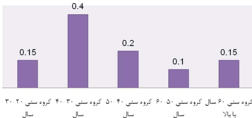
نمودار شماره ۱- میانگین سنی پاسخگویان