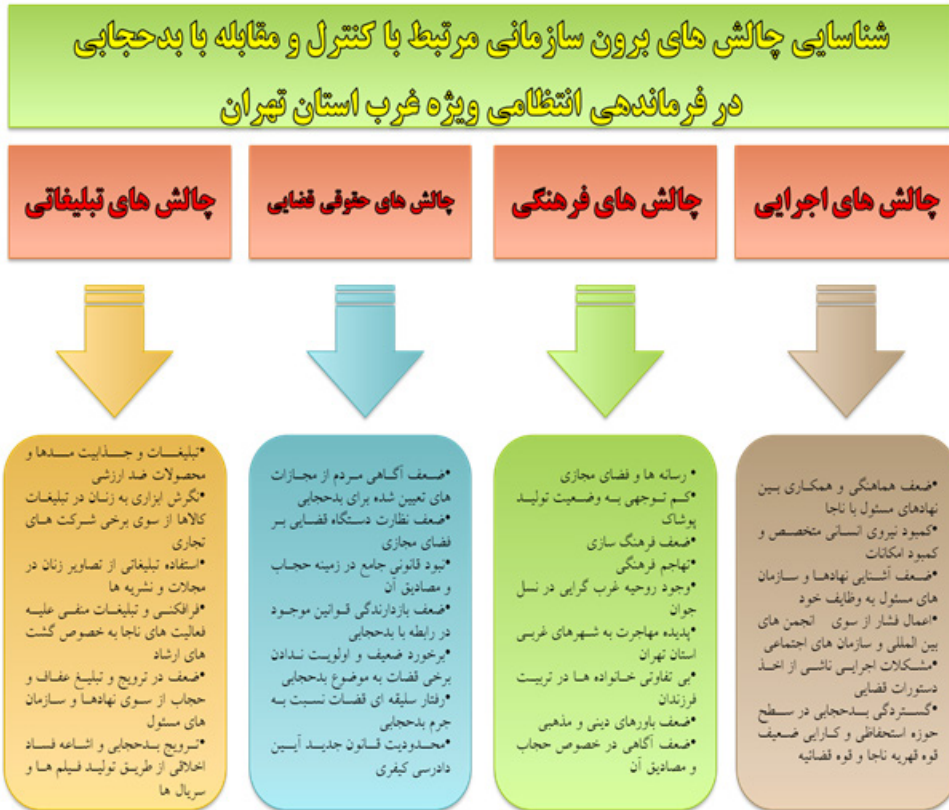
شکل شماره ۲: مدل تحلیلی تحقیق

بر اساس نتایج به دست آمده، می توان مدل مفهومی تحقیق را به صورت شکل شماره ۲ طراحی و ارائه نمود: