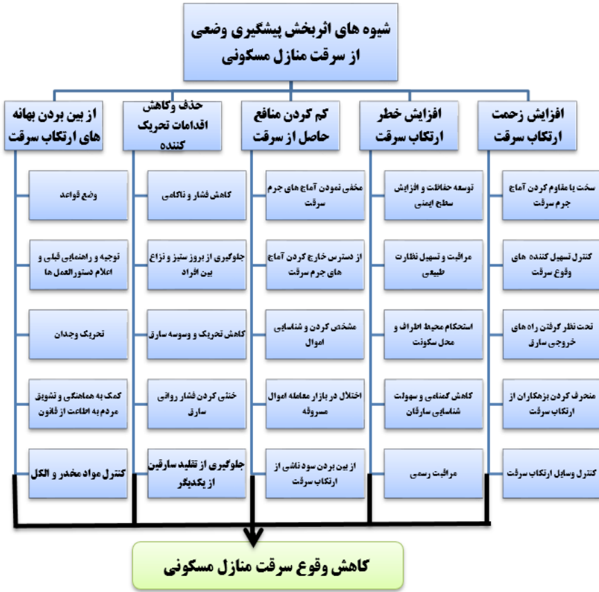
نمودار شماره ۳: مدل مفهومی تحقیق