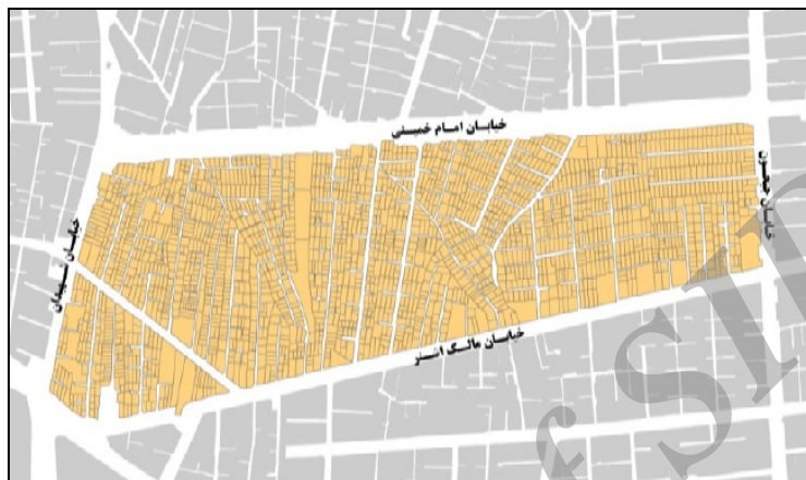
نقشه (۲) موقعیت منطقه ۱۰ در شهر تهران