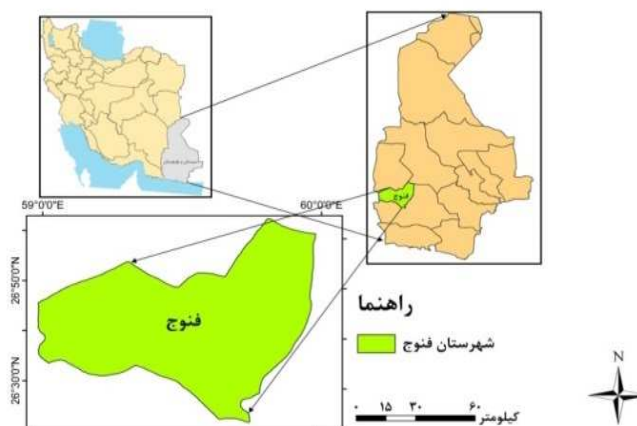
شکل (۱) نقشه راهنمای منطقه مورد مطالعه، نگارندگان، ۱۳۹۳

شهر فنوج در حدود مختصات جغرافیایی طول ۲۶ درجه و ۳۴ دقیقه شمالی و عرض ۵۹ درجه و ۳۸ دقیقه شرقی، در شمال غرب شهرستان نیکشهر و در جنوب استان سیستان و بلوچستان استقرار یافته است. طبق آخرین تقسیمات شکل (۱) موقعیت استقرار شهر فنوج در استان نشان داده شده است.