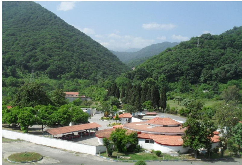
شکل شماره (۳): عکس از نمای آبگرم هتل، (منبع: میرتقیان، ۱۳۹۱: ۱۵)