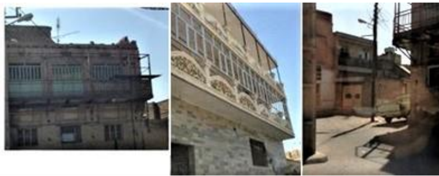
شکل شماره ۵: نمایی از پنجره و سایبان ساختمان‌های شهر ماهشهر