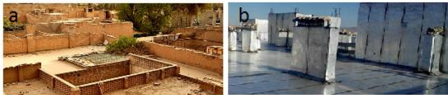
شکل شماره ۳: وضعیت بام در بافت قدیم، b در بافت جدید شهر ماهشهر

از بین نمونه‌های انتخابی سقف کلیه آن‌ها مسطح است و بام انواع قدیمی‌تر این ساختمان‌ها در گذشته با سیمان یا با آسفالت نرم یا با قیر گونی پوشیده می‌شد که این با توجه به گرمای هوا و شدت تابش در بیش از ۷ ماه از سال منجر به قیر و جاری شدن در ناودان‌ها می‌شد. استفاده از آسفالت در بام ساختمان‌ها در بافت قدیم نیز به علت تولید بیش از حد گرما در تابستان مناسب نیست. در سال‌های اخیر در بام ساختمان‌های بافت جدید از ایزوگام ساده و یا ایزوگام با پوشش آلومینیومی استفاده می‌کنند که سطحی براق داشته و جذب انرژی خورشیدی در آن کمتر است زیرا بیشتر آن را منعکس می‌کند در حالی که نوع ساده و تیره‌ی آن در جذب انرژی خورشیدی و انتقال آن به فضاهای داخلی و گرمایش آن موثر می‌باشد (شکل ۳).