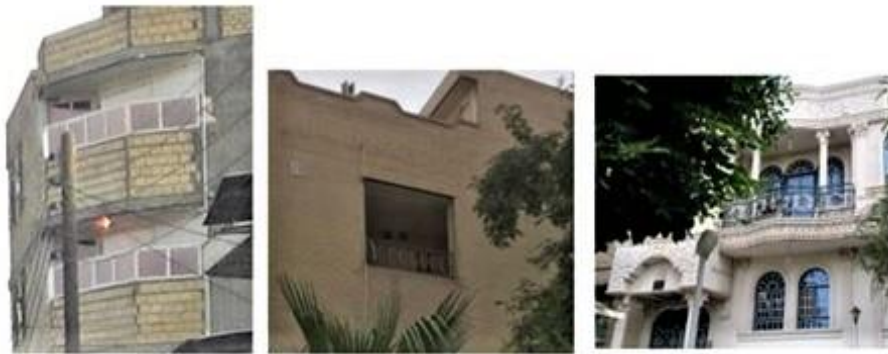
شکل شماره ۴: نمایی از پنجره و سایبان ساختمان‌های شهر ماهشهر