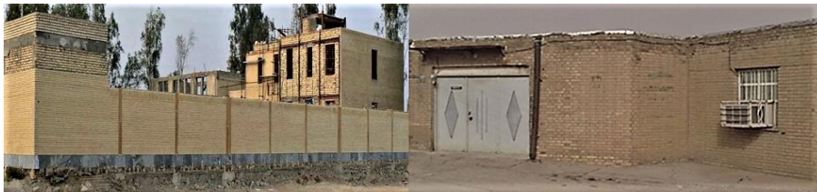
شکل شماره ۶: نمایی از جنس مصالح به کار رفته در ساختمان‌های انتخابی شهر ماهشهر

با توجه به تحقیقات صورت گرفته در بافت جدید ۷ مورد از ساختمان‌های انتخابی نوساز، ۴ تا قابل قبول، ۳ تا مرمتی و ۲ مورد نیز تخریبی است. در حالی که در بافت قدیم ۲ مورد نوساز ۱ مورد قابل قبول و ۱ نمونه از ساختمان‌های مورد مطالعه مرمتی است.