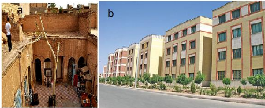
شکل شماره ۲: a: قرارگیری ساختمان در بافت قدیم، b: بافت جدید شهر ماهشهر

-در بررسی بافت قدیم به دلیل این که به زوایای تابش خورشیدی کمتر اهمیت داده می‌شد و معمولاً اتاق‌ها در اطراف حیاط پراکنده بودند در تمام ساعات روز در یک قسمت از ساختمان تابش وجود دارد و با توجه به شرایط اقلیمی ماهشهر که دما مهم‌ترین پارامتر در ایجاد عدم آسایش اقلیمی است این عامل بسیار مهم است. همچنین به دلیل این که ساختمان‌ها با ارتفاع کمی از زمین ساخته می‌شدند ساکنین از وجود رطوبت در شرایط عدم آسایش قرار دارند. در بافت جدید ماهشهر به اصول معماری همساز با اقلیم بیشتر اهمیت داده می‌شود و جهت گیری ساختمان‌ها با هدف کمترین جذب تابش در تابستان طراحی می‌شود (شکل ۲).