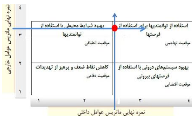
شکل (۲): نمره نهایی ماتریس عوامل خارجی و داخلی

امتیاز نهایی از ضرب ضریب در رتبه به دست می آید. جمع نمره نهایی از ۱ تا ۱/۹۹ نشان دهنده ضعف داخلی سیستم است. نمره ها از ۲ تا ۲/۹۹ نشان دهنده وضعیت متوسط سیستم و نمره های ۳ تا ۴ بیانگر این است که سیستم در وضعیت عالی قرار دارد (ترکمن نیا و همکاران، ۹۱:۱۳۹۰)