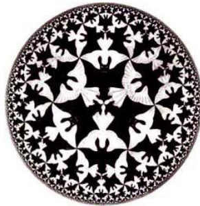
شکل ۲. نمادی از سیرنیتیک چهارم (Attainable Utopias).

نظریه سامانه دیالکتیک جهانی ۱ را که پلی است بین علوم طبیعی و انسانی، به‌عنوان هدف اصلی سیرنیتیک چهارم پیشنهاد می‌کنند. این نظریه به افراد انسانی کمک می‌کند تا ارزش‌ها و هنجارهای کل‌گرایی را بپذیرند و از طریق همکاری بین‌رشته‌ای و گفت‌وگو، به افرادی نوآور و خلاق برای حل مسائل جامعه تبدیل شوند. از این منظر دانش از طریق شناختی پویا و نه ایستا و به کمک ارتباطات علمی در سطح جهانی حاصل می‌شود. لازم به ذکر است که سیرنیتیک چهارم از ارتباطات علمی که از مباحث مهم علم اطلاعات و دانش‌شناسی است، بهره می‌برد. بنابراین علم اطلاعات و دانش‌شناسی از حوزه‌هایی است که سیرنیتیک چهارم در آن به‌خوبی متبلور می‌گردد و برای توسعه علمی جوامع که در نهایت منجر به پیشرفت در دیگر زمینه‌ها می‌شود، پشتوانه بسیار مناسبی است. به شکل ۲ ۲ توجه کنید.