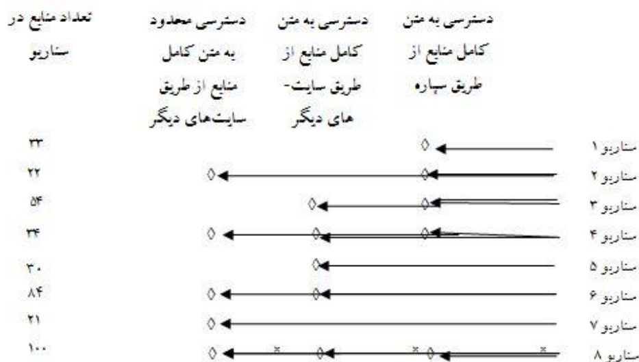
شکل ۲. فراوانی دسترسی به منابع مخازن سازمانی کشور از طریق موتور جستجوی گوگل در سناریوهای مختلف