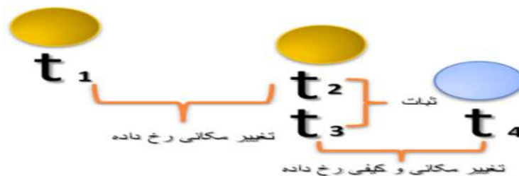
رسم توضیحی ۱: تغییر اتمی در لحظات مختلف

ها خلق شود، ناظر هیچ تغییری را دریافت نمی‌کند. واگر در t_1 ، علاوه بر مکان متفاوت با ویژگی‌های کیفی دیگری خلق شود، ناظر علاوه بر تغییر مکانی، تغییر کیفی را نیز دریافت می‌کند.