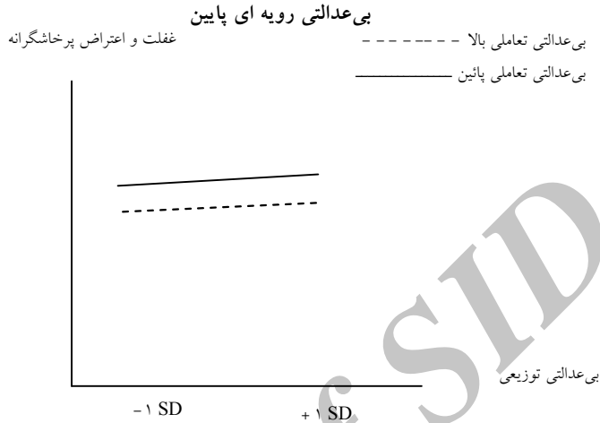
شکل ۳ - رابطه بی‌عدالتی توزیعی با غفلت و اعتراض پرخاشگرانه در بی‌عدالتی رویه ای پایین و سطوح دوگانه بی‌عدالتی تعاملی

چنانکه در شکل ۲ مشاهده می‌شود، بی‌عدالتی توزیعی با غفلت و اعتراض پرخاشگرانه در سطح بی‌عدالتی تعاملی بالا و در بی‌عدالتی تعاملی پایین دارای رابطه مثبت و معنادار است، اما این رابطه در بی‌عدالتی رویه‌ای پایین معنادار نیست.