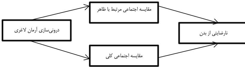
شکل ۱. الگوی پیشنهادی پژوهش حاضر

به‌عنوان میانجی رابطه بین درونی‌سازی آرمان لاغری و نارضایتی از بدن در دانشجویان دختر مورد بررسی قرار گرفت. شکل ۱ الگوی پیشنهادی پژوهش حاضر را نشان می‌دهد.