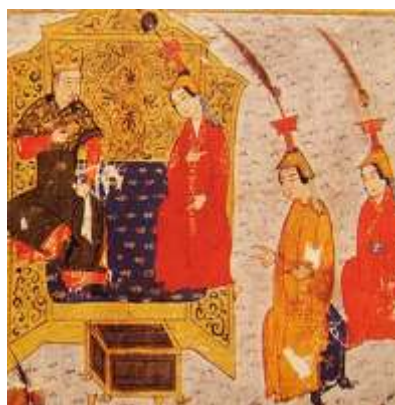
تصویر ۱: بوقتا، جامع‌التواریخ، نیمه اول سده هشتم ق، برگرفته از (همدانی، ۱۳۷۳، ج ۴).

بوقتا در فرهنگ مغول جایگاهی خاص و کاربردهایی ویژه داشت. این سرپوش تاج ملکه به شمار می‌رفت و در روز تاج‌گذاری بر سر اولین همسر خان نهاده می‌شد: «...روز یکشنبه بیست و ششم (ذی القعدة سال ۷۰۴ ق) بر سر قتلغشاه خاتون دختر امیر ایرنجین بوغتا نهادند...» (قاشانی، ۱۳۴۸: ۴۴). استفاده دیگر این سرپوش در زمانی بود که یک قوما - زن غیر رسمی - بنابر شرایطی در ردیف خاتون‌ها قرار می‌گرفت و ارتقاء مقام می‌یافت. چنانچه در جامع‌التواریخ آمده است: «... اباقاخان توقیتی خاتون را که قومای هلاکوخان بود با خود گرفت و بجای توقوز خاتون بوغتا بر سر نهاد و خاتون شد.» (همدانی، ۱۳۷۳، ج ۲: ۱۰۵۵) یا «...مادر او قومایی بوده... و بعد از مدتی بوغتا بر سر نهاد...» (همدانی، ۱۳۷۳، ج ۲: ۹۶۸).