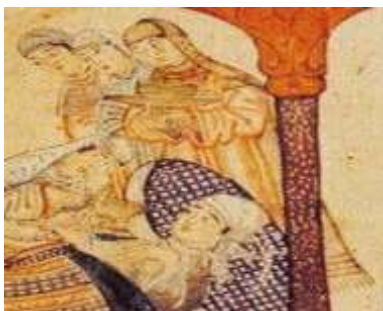
تصویر ۶: مقنعه، جامع التواریخ، نیمه اول سده هشتم ق، برگرفته از (همدانی، ۱۳۷۳، ج ۴).

شده پوشیده...» (ابن بطوطه، ۱۳۷۰، ج ۱: ۴۰۵). این نوع از مقنعه را در تصویر شماره ۶ از جامع التواریخ بر سر زنانی که در مقابل غازان خان ایستاده‌اند می‌توان مشاهده نمود.