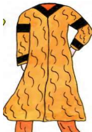
تصویر ۱۹: نمونه‌ای از قباهای قبل از دوران ایلخانان، برگرفته از (چیت‌ساز، ۱۳۷۹: شکل ۴۸۵).

اما لباس زنان در دوره ایلخانی؛ چه لباس زنان مغول و چه لباس زنان ایرانی بسیار بلند بود، به نحوی که در نگاره‌ها شلوار و در برخی موارد حتی کفش زنان قابل رویت نیست. نمونه‌ای از قباهای کوتاه‌تر در نگاره‌های بر جای مانده از دوران ایلخانی مشاهده نشد. شکلی از قباهای متداول در پیش از دوران ایلخانان که قدی کوتاه و آستین‌هایی چسبان داشت در تصویر ۱۹ قابل مشاهده است.