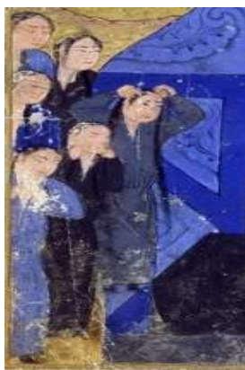
تصویر ۱۰: نوع دیگر تن پوش زنان مغول، جامع‌التواریخ، نیمه اول سده هشتم ق، برگرفته از (همدانی، ۱۳۷۳، ج ۴).

اختلاف در قدرت خرید پوشاک و تهیه آن در بین طبقات مختلف اجتماعی مهم‌ترین عاملی است که پوشاک را به عنوان یکی از نشانه‌های شاخص اختلاف طبقاتی مطرح ساخته است. به همین دلیل ارتباط مستقیمی میان نوع پوشاک و دیگر ویژگی‌های فرد وجود دارد و گاه انتخاب یک نوع خاص از پوشاک اصرار بر نمایش برتری شخص نسبت به عموم مردم است (پاکتچی، ۱۳۸۵، ج ۱۴: ۴۴). دو لباس گران‌بهای طبقات بالای اجتماعی در دوره ایلخانی جامه‌های نخ و نسیج بود (جوینی، بی‌تا، ج ۱: ۱۷۶). جامه نسیج دوخته شده از پارچه‌ای پربها در روزگار ایلخانان بود که این پارچه از ابریشم و طلا ساخته می‌شد (Kadoi, 2009: 21). ابن بطوطه نخ را جامه حریر مذهب و نسیج را حله‌ای مرصع به جواهر دانسته است (ابن بطوطه، ۱۳۷۰، ج ۱: ۴۰۵ و ۴۲۰). استفاده از این قسم پارچه‌ها در تولید لباس را می‌توان به عنوان میراث زندگی کوچ نشینی به شمار آورد. کوچ نشینان ثروتمند آسیای مرکزی لباس‌هایی رویی خود را با طلا تزئین می‌کردند (Kadoi, 2009: 21).