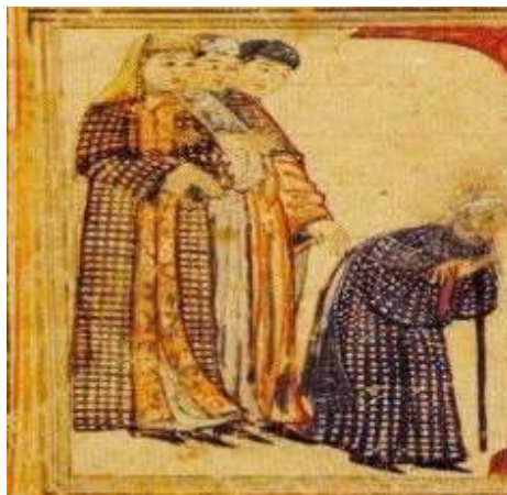
تصویر ۱۳: کفش، جامع‌التواریخ، نیمه اول سده هشتم ق، برگرفته از (عکاشه، ۱۳۸۰: ۱۱۵).

در مکاتبات رشیدی به همراه کفش ذکری از موزه تیماج (منظور کفش ساق‌بلند از پوست بز می‌باشد) برای ساکنان ربع رشیدی به میان آمده است در حالیکه برای مزارعان تنها از کفش نام برده شده است (همدانی، ۱۹۴۵: ۱۹۵). بنابراین موزه پای‌پوش اقشار بالای جامعه بود. ابن بطوطه نیز می‌نویسد که زنان شیرازی موزه به پا می‌کردند (ابن بطوطه، ۱۳۷۰، ج ۱: ۲۵۱). کلمه‌ای که او بکار برده خُف می‌باشد که به معنی نوعی پوتین تا ساق پاست (دزی، ۱۳۸۸: ذیل سَرْمُوز). می‌توان شکل کلی پای‌پوش یک زن را در تصویر ۱۳ از جامع-التواریخ دید. برخلاف مردان که در نگاره‌ها موزه‌های رنگارنگ در پای دارند، پای‌پوش زنان تماماً سیاه رنگ هستند.