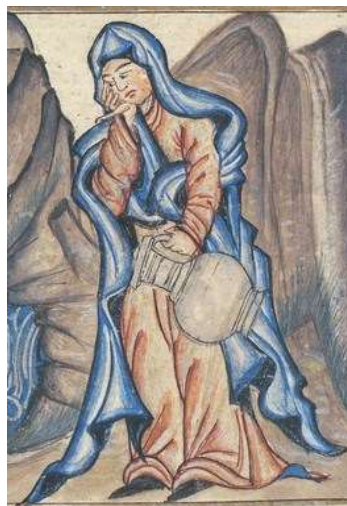
تصویر ۸: چادر، جامع‌التواریخ، نیمه اول سده هشتم ق، برگرفته از (اقبال، ۱۳۸۴: ۴۹).