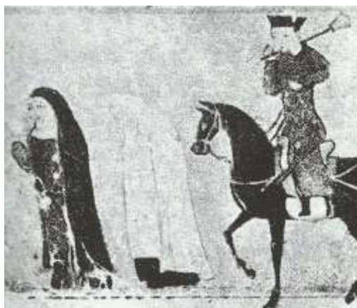
تصویر ۷: چادر، جامع‌التواریخ، نیمه اول سده هشتم ق، برگرفته از (عکاشه، ۱۳۸۰: ۱۱۴).