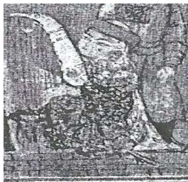
تصویر ۴: مقنعه و پیشانی‌بند، شاهنامه مکتوب، اوایل سده هشتم ق، برگرفته از (پوپ، ۱۳۳۸: ۱۷۰).

نمونه دیگر مقنعه در نگاره‌ها، از دو قسمت تشکیل شده؛ تکه روی سر این نوع پوشش یا کوتاه است یا تا پشت زانو امتداد می‌یابد. این سرپوش در نقاشی‌هایی که از داستان‌های پیامبران ترسیم شده است بر سر زنان دیده می‌شود و در تصویر شماره ۵ از جامع التواریخ که ولادت حضرت محمد (ص) را نشان می‌دهد قابل مشاهده است.