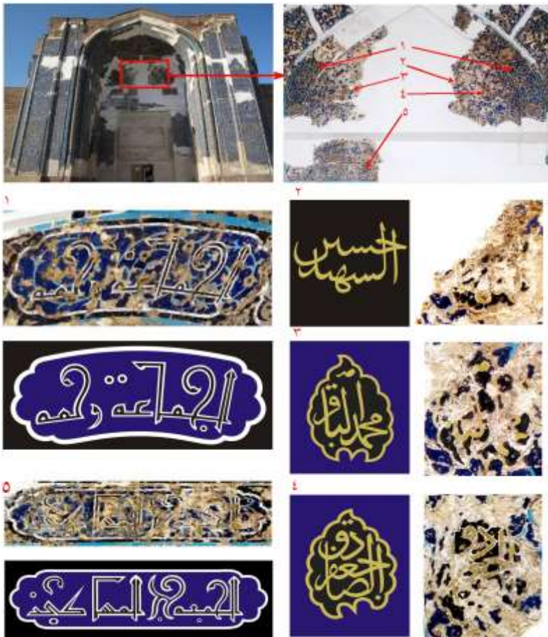
تصویر ۳: کتیبه بالای سردر مسجد کبود و شکل بازسازی شده اجزای آن که توسط نگارندگان کشف و قرائت گردید: ۱- الجماعه رحمه، ۲- حسین الشهید، ۳، محمد الباقر، ۴- جعفر الصادق، ۵- الجمعه حج المساکین، (منبع: نگارندگان)

کتیبه‌ای با خط بنایی متداخل در محراب میان دو فضای صحن و شاه‌نشین قرار دارد که کلمه محمد نوشته شده و سوره‌ی کوثر در داخل آن به اجرا در آمده است. سوره کوثر در شأن امّ الائمه، حضرت فاطمه(س) نازل شده است (تصویر ۲). نام امامین حسن و حسین (ع) نیز زیر مقرنس همین فضا به چشم می‌خورد. این دو نام در تزیینات دیوار جنوبی رواق شمال غربی مسجد نیز به خط بنایی اجرا شده است.