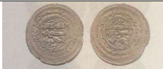
تصویر شماره ۷