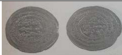
تصویر شماره ۶