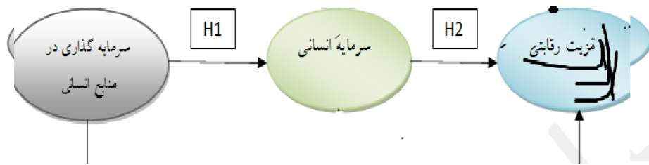
شکل نمودار ۱. مدل مفهومی تحقیق