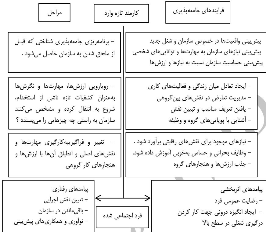
شکل ۱. الگوی جامعه‌پذیری سازمانی

در پژوهشی که کلن و همکارانش (۲۰۰۶) در مورد جامعه‌پذیری انجام دادند، به این نتیجه رسیدند که تأثیر غیرمستقیم تجربه‌ها و دانش افراد در مورد سازمان پیش از ورود به آن، به واسطه عواملی مانند ارزش‌ها، سیاست‌ها و تاریخچه سازمان بر جامعه‌پذیری‌شان، بیشتر از تأثیر مستقیم این دو متغیر بر هم است و نقش میانجی‌گری ارزش‌ها، سیاست‌ها و تاریخچه سازمان را اثبات کردند [۱۳]. اما در این پژوهش سنوات کاری و ارشدیت کارکنان به‌دلیل اینکه متغیری فردی است و در آشناسازی کارکنان با سازمان و ویژگی‌های آن می‌تواند مؤثر باشد، به‌گونه‌ای که با افزایش سنوات کاری میزان آگاهی و شناخت کارکنان از رویه‌ها و خط‌مشی‌های سازمانی افزایش می‌یابد و می‌توان آن را به‌عنوان متغیر مستقل ثانوی در نظر گرفت، به‌عنوان متغیر تعدیل‌گر در نظر گرفته شد. با توجه به این امر، مدل مفهومی پژوهش در شکل شماره ۲ نشان داده شده است.