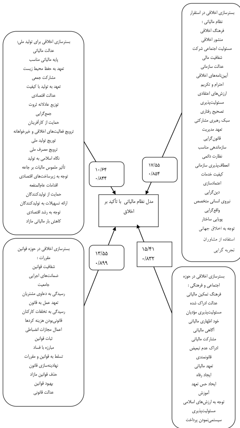
شکل ۳. مدل عملیاتی و نهایی نظام مالیاتی اخلاق‌گرا