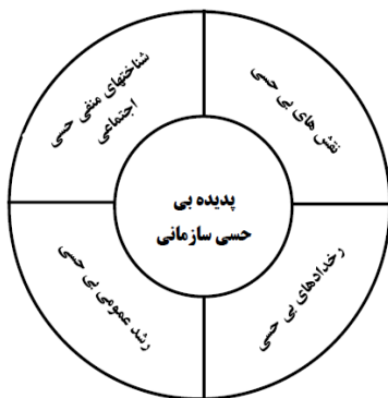
الگوی ۲. لایه اول شکل‌دهنده پدیده بی‌حسی سازمانی

در جدول ۳، کدگذاری باز، محوری و انتخابی لایه اول شکل‌دهنده مفهوم بی‌حسی ارائه شده است. لایه اول شکل‌دهنده مفهوم بی‌حسی دارای ۴ کد اصلی شامل ۱. شناخت‌های بی‌حسی - اجتماعی منفی؛ ۲. نقش‌های بی‌حسی؛ ۳. رخداد‌های بی‌حسی و ۴. رشد عمومی بی‌حسی است. بر اساس یافته‌های پژوهش، مفهوم بی‌حسی زمانی رخ می‌دهد که ابتدا رخداد‌های بی‌حسی، نقش‌های بی‌حسی، رشد عمومی بی‌حسی و شناخت بی‌حسی - اجتماعی منفی نمود پیدا کنند؛ بنابراین ۴ توصیف‌گر بالا نشان‌دهنده بروز بی‌حسی سازمانی در مراحل اولیه است.