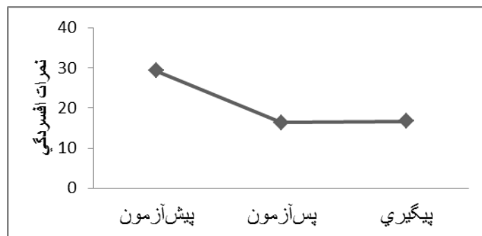
نمودار ۱) مقایسه درون آزمودنی نمرات افسردگی در سه سطح مداخله

هیجانی منجر به کاهش اندیشناکی نیز می‌گردد ( p < ۰/۰۰۰۱, p = ۱۳ تفاوت میانگین‌ها). همچنین تفاوت