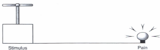
تصویر ۱. زدن کلید و روشن شدن لامپ قیاسی است از رابطه یک‌به‌یک بین میزان آسیب و شدت درد

تغییرات ایجاد شده در مفهوم درد نمونه‌ای است از تغییر مفهوم بیماری طی زمان. تلاش‌های نخستین انسان برای تبیین درد به‌شدت از دوالیسم دکارت ۲ متأثر بود. نظریه دکارتی درد ۳ که بر فرض رابطه یک‌به‌یک بین میزان آسیب و تجربه درد استوار بود، سال‌ها بر پژوهش و درمان درد حاکم بود. بر پایه این نظریه، هرچه شدت آسیب بیشتر باشد، شدت درد بیمار بیشتر است و در غیاب آسیب‌دیدگی، دردی وجود نخواهد داشت. اگرچه این فرض با تجربه انسان از درد حاد منطبق است، اما قادر به تبیین همه دردها از جمله درد مزمن نیست.