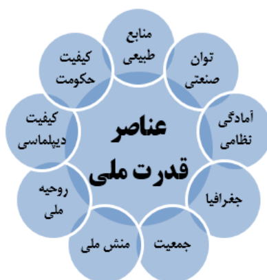
عناصر قدرت ملی از منظر هانس جی مورگنتا