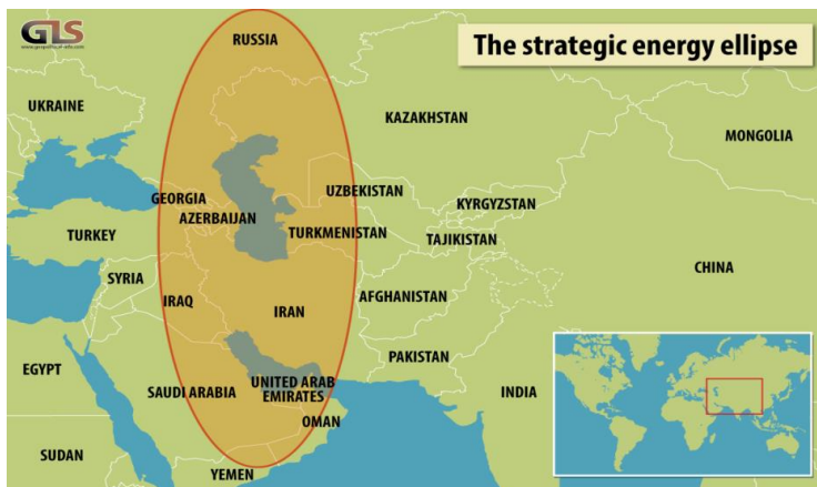
تصویر ۲: بیضی استراتژیک انرژی

بیضی استراتژیک انرژی ۱ یک منطقه انرژی است که از جنوب روسیه تا کشورهای حاشیه خلیج فارس امتداد یافته و بیش‌ترین میزان ذخایر اثبات‌شده نفت و بیش از ۴۰ درصد از ذخایر گاز طبیعی را در برمی‌گیرد (Kemp, 2010: 180). بخش گسترده‌ای از این منطقه جغرافیایی را ایران تشکیل می‌دهد، هم‌چنین بخش بزرگی از عراق و قسمتی از سوریه، تشکیل‌دهنده پهنه غربی این بیضی است. اتحاد میان سه دولت، با اتصال جغرافیایی حاصل آمده میان این سه دولت، امکان تسلط هم‌افزا بر این منطقه راهبردی و بهره‌گیری از ظرفیت‌های آن را در اختیار سه دولت قرار می‌دهد.