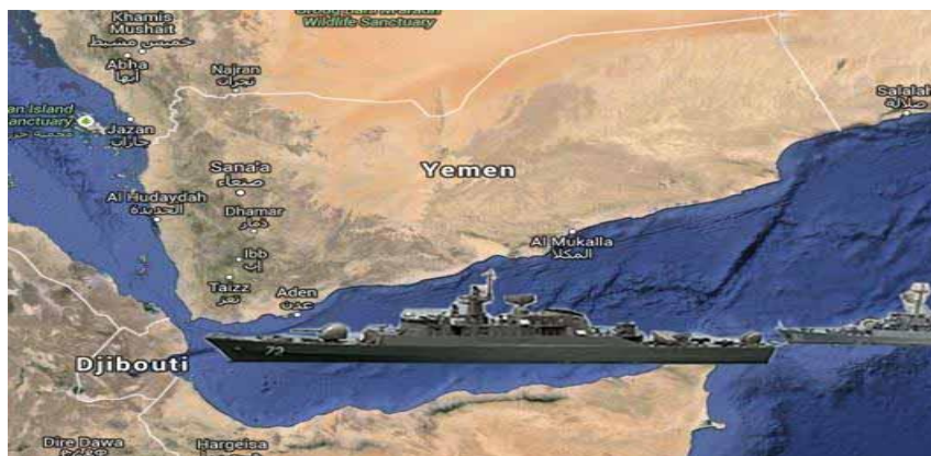
نقشه ۱: موقعیت راهبردی یمن (خبرگزاری میزان، ۱۳۹۴/۷/۱۵)