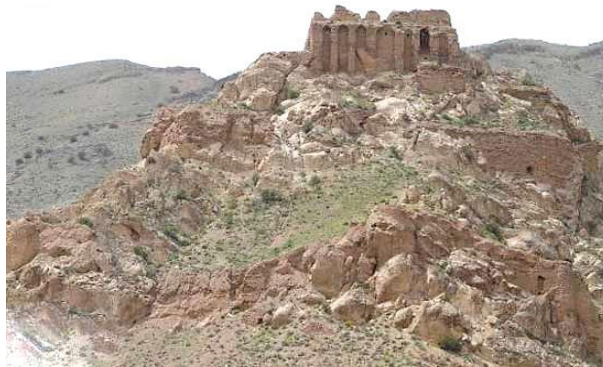
تصویر ۱: بنای ساسانی قیز قلعه (نیرومند، ۲۰۰۸)