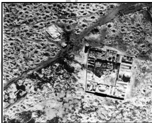
تصویر ۲: مسجد جامع ساوه، محصور در میان گودال‌های حفر شده توسط کاوشگران غیرمجاز - عکس هوایی سال ۱۳۱۵ (اشمیت، ص ۹۳)

آن‌گونه که محمدیوسف کیانی ۱۷ آورده است، ساوه در این دوره از مراکز مهم و فعال تولید سفال نیز بوده است (کیانی، پیشینه سفال و سفالگری در ایران، ص ۳۴؛ کریمی و کیانی، ص ۴۸). اریک فردریش اشمیت (Erich Friedrich Schmidt)، نیز ساوه را از مراکز مهم سفالگری دانسته (ص ۷۶) و با ارجاع به عکس هوایی سال ۱۳۱۵ که مسجد جامع ساوه را محصورشده در میان گودال‌های کاوش‌های غیرمجاز نشان می‌دهد (تصویر ۲)، در پی اثبات آن است که خاک ساوه آثار زیادی را در خود داشته است (همان، ص ۹۳).