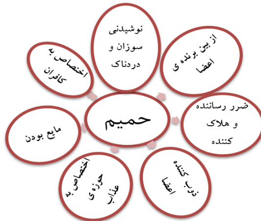
شکل ۲. مؤلفه‌های معنایی حمیم