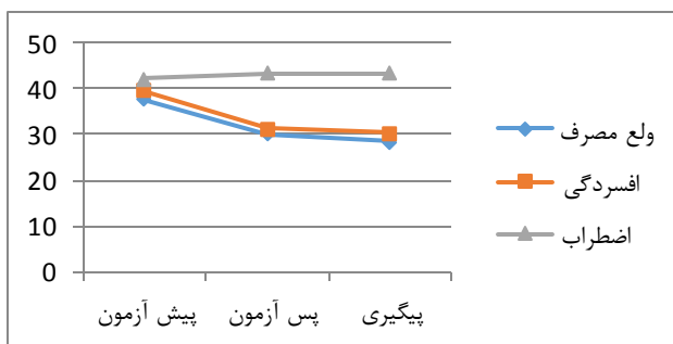
نمودار ۱: تغییرات نمرات نفر اول در ولع مصرف، افسردگی و اضطراب

نتایج جدول ۲ نشان می‌دهد که ولع مصرف و افسردگی در هر سه آزمودنی تحت درمان به طور بالینی کاهش یافته است زیرا میزان درصد بهبودی و اندازه اثر نشان‌دهنده این تغییرات می‌باشد اما در متغیر اضطراب فقط در نفر سوم باعث کاهش اضطراب شده اما در نفرات اول و دوم اثری نداشته است. اندازه‌های اثر به دست آمده نشان‌دهنده تأثیر مداخله تحریک فراجمله‌ای از طریق جریان الکتریکی مستقیم می‌باشد و اندازه‌های اثر به دست آمده طبق تقسیم‌بندی کوهن جز اندازه‌های اثر بزرگ محسوب می‌شود.