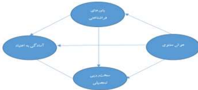
شکل ۱. مدل مفهومی ارتباط هوش معنوی با آمادگی به اعتیاد با میانجی‌گری باورهای فراشناختی و سخت‌رویی تحصیلی

انجام شده و به دنبال پاسخ به این سوال است که آیا هوش معنوی با میانجی‌گری باورهای فراشناختی و سخت‌رویی تحصیلی می‌تواند آمادگی به اعتیاد را در دانشجویان پیش‌بینی نماید؟ بررسی متغیرهای مذکور در این تحقیق به صورت مدل علی و اثرگذاری هر کدام در مدل پیشنهادی مطابق شکل (۱) می‌تواند به ایجاد دانش جدید در این حوزه کمک کند.