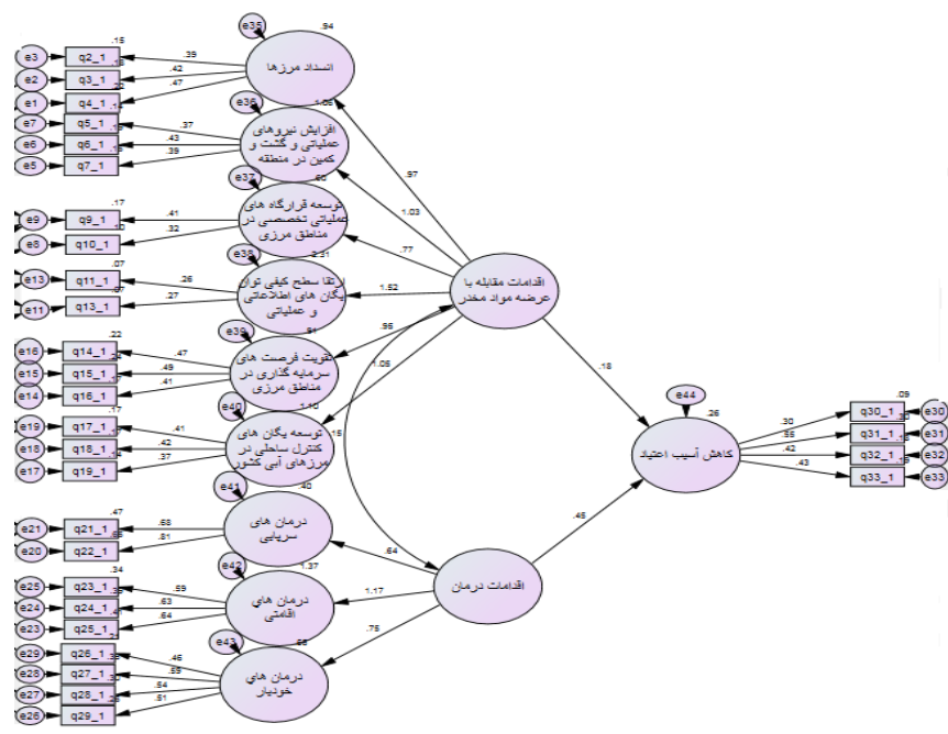
شکل ۱: مدل برازش شده جهت تعیین میزان تاثیر متقابل اقدامات مقابله با عرضه و درمان و کاهش آسیب اعتیاد