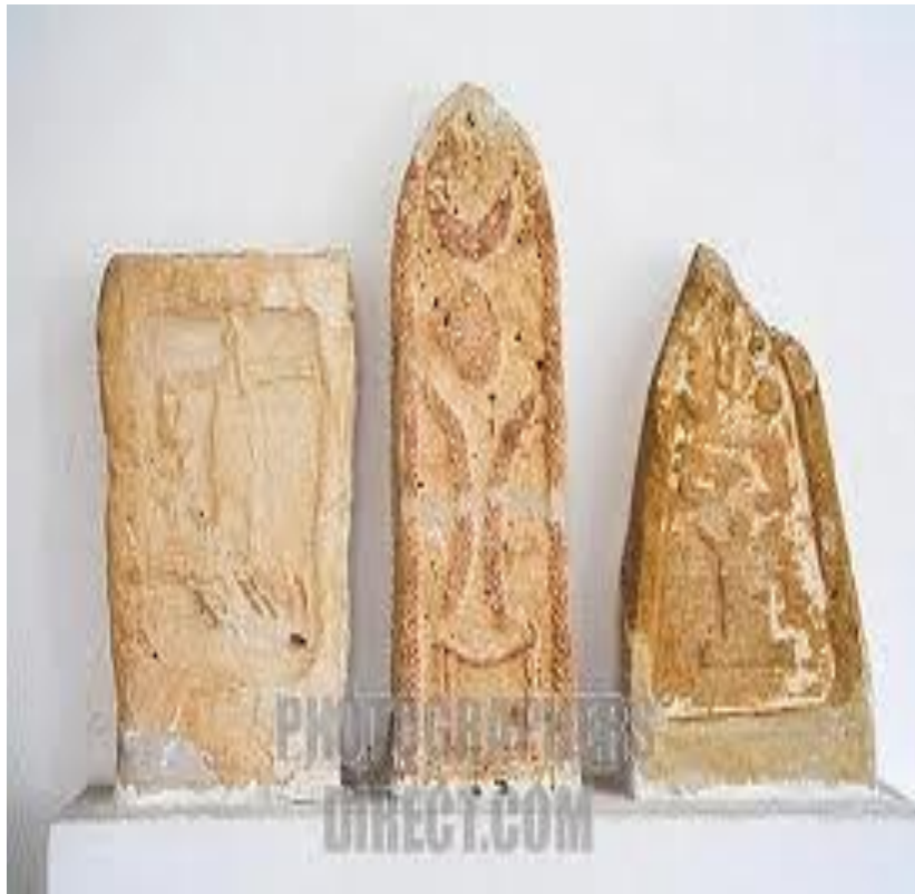
تصویر ۲- استل‌های به دست آمده در کاوش‌های باستان‌شناسی