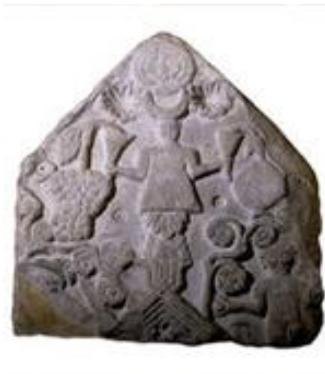
تصویر ۴- استل‌های به دست آمده در کاوش‌های باستان‌شناسی