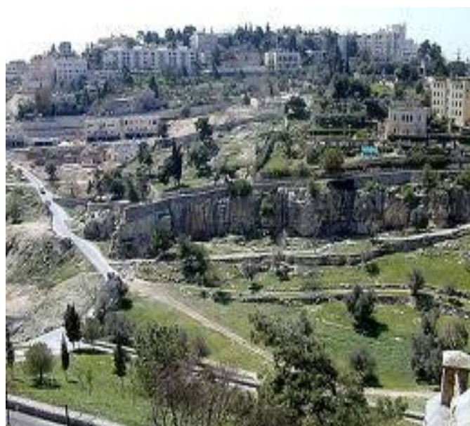
تصویر ۱- منطقه امروزی توفت