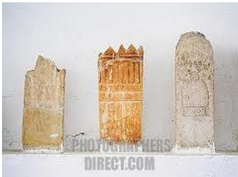
تصویر ۳- استل‌های به دست آمده در کاوش‌های باستان‌شناسی