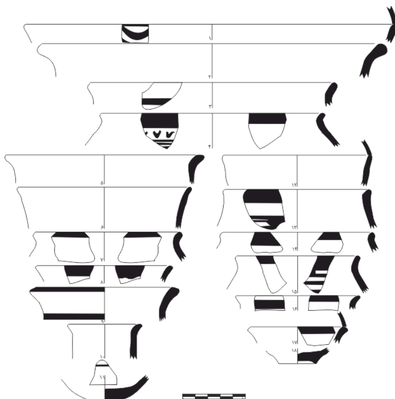
شکل ۲. نمونه‌ای از طرح سفال‌های یافت‌شده از لایه‌های استقرار مربوط به دوره گودین ۳ در محوطه فلک‌الافلاک خرم‌آباد