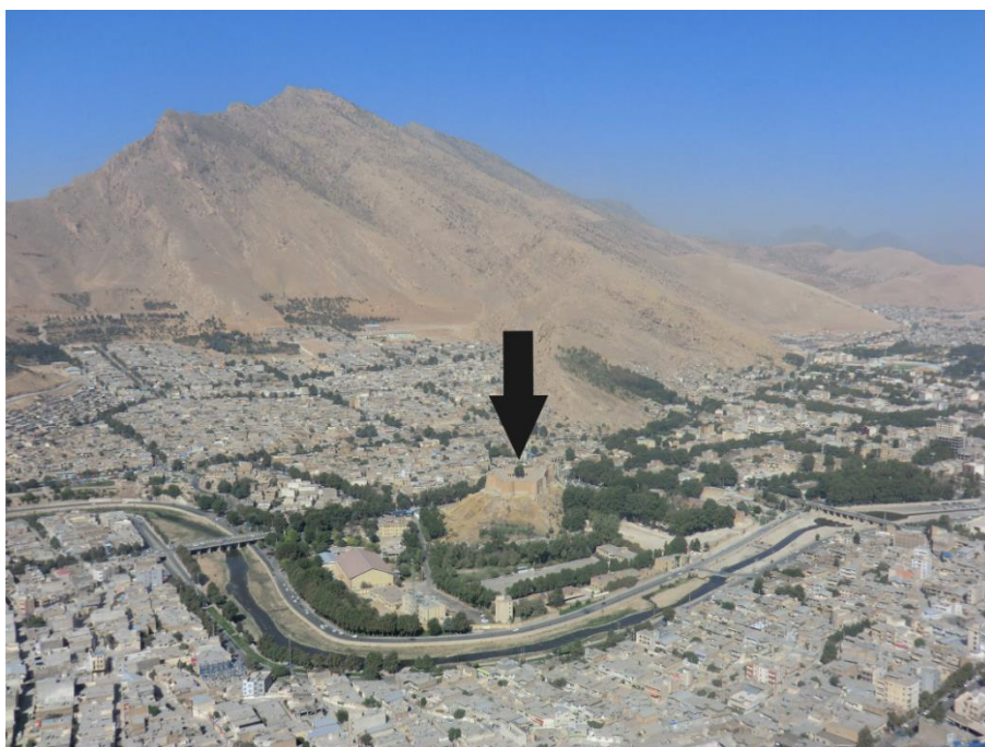
تصویر ۳. موقعیت قلعه فلک‌الافلاک نسبت به شهر و رودخانه خرم‌آباد، دید از جنوب شرق (نگارندگان، پاییز ۹۵)