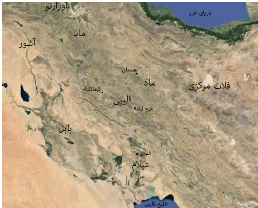
تصویر ۱. وضعیت سیاسی منطقه در سده‌های آغازین هزاره اول پ.م.