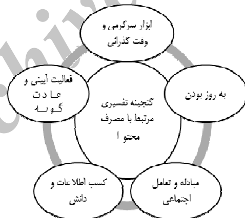
نمودار ۲. گنجینه تفسیری مرتبط با مصرف محتوا

تفسیر جوانان از مصرف محتوا عمدتاً در ذیل چهار مفهوم جای می‌گیرد. جوانان مصرف محتوا را عمدتاً وسیله‌ای برای سرگرمی و وقت‌گذرانی، به‌روز بودن و مبادله اجتماعی در نظر می‌گیرند. همچنین بسیاری از جوانان در تفسیر تجربه مصرف محتوا آن‌را بخشی از عادات استفاده خود می‌دانستند، به این معنا مصرف محتوا برای برخی از جوانان حالت آئینی و عادت‌وار به خود دارد.