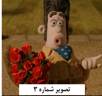
تصویر شماره ۳

والاس و گرومیت: این انیمیشن محصول سال ۲۰۰۶ می‌باشد و داستانش از این قرار است که مردم به والاس ۱ که یک مرد است و سگ او به نام گرومیت ۲ پول می‌دهند تا با گرفتن خرگوش‌ها از مزارع آنها محافظت کند. او خرگوش‌ها را به جای دیگری منتقل می‌کند و آزاری