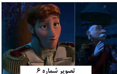
تصویر شماره ۶

یخ زده، این انیمیشن محصول سال ۲۰۱۴ و داستان دو خواهر است که یکی از آنها به دلیل توانایی‌اش در منجمد کردن هر چیزی و ناتوانی در کنترل آن به میل خود و پدر و مادرش در خانه می‌ماند. بعد از مرگ پدر و مادرش او ملکه می‌شود