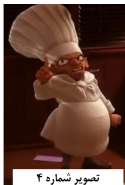
تصویر شماره ۴

به پسرش می‌رسد ولی در این بین سرآشپز اصلی رستوران نمی‌خواهد لینگوینی به حقش برسد. ولی در نهایت این پسر جوان صاحب رستوران می‌شود. «دیگری» در این انیمیشن مرد کوتوله میانسالی است (تصویر شماره ۴) که موهای مشکی دارد و ویژگی‌های ظاهری‌اش نیز مشابه مهاجران آسیای شرقی است. او تلاش می‌کند که صاحب رستورانی بماند که در حقیقت متعلق به قهرمان داستان است.