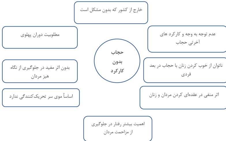
نمودار ۱. کدهای مرتبط با کد حجاب بدون کارکرد

در دسته دیگر (شامل دسته ضدیت با حجاب) افراد علاوه بر آنکه اصل حجاب را نپذیرفته بودند، اقدامی علیه آن نیز داشتند. مهمترین این اقدامات حضور با لباس سفید در روز چهارشنبه در خیابان‌ها بود. آنها معتقد بودند، حجاب امری غیرلازم و غیرضروری است، حتی یکی از خانم‌ها اساس حجاب را به علت حضور مردان و به خاطر آنان می‌دانست که به‌وسیله آن، زنان را به سیطره درآورند. در این دسته اصل و مبنای رفتار عقلانی را عریانی می‌دانند و پوشش به هر میزان، علت جداگانه‌ای لازم دارد. یعنی خانم‌ها برای پوشیده بودن خود دلایل یا علت‌هایی را بیان می‌کردند، نه برای کمتر کردن پوشش خود.