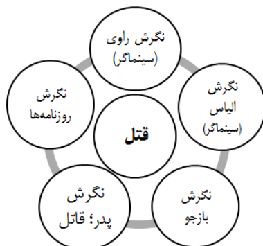
نمودار ۳. چشم‌انداز روایی