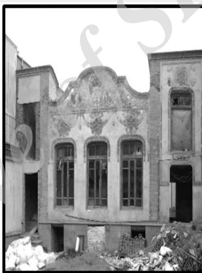
تصویر ۱. نمای بیرونی اتاق شاهانشین خانه حریرری تبریز