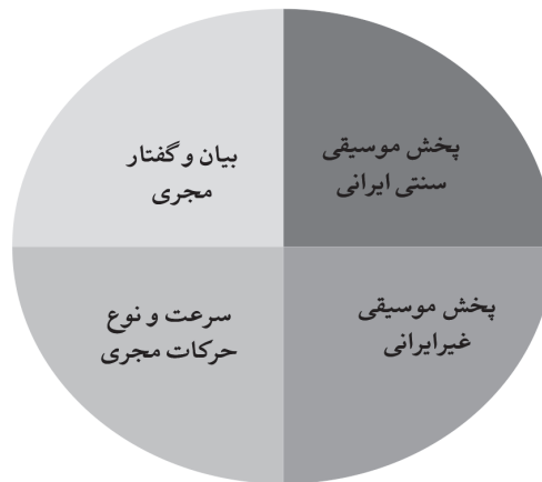
ظاهر و ساخت برنامه

شکل ۵. زیرمقوله‌ها در مقوله ظاهر و ساخت برنامه در شبکه‌های داخلی را نشان می‌دهد.