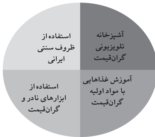
شکل ۴. زیرمقوله‌ها در مقوله وضعیت تجمل گرایی در شبکه‌های داخلی را نشان می‌دهد.