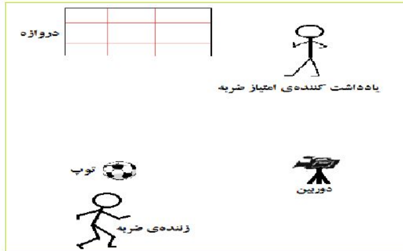
شکل ۲. نحوه دریافت اطلاعات

برای نشانه‌گذاری، از هفت نشانه استفاده شد که شش نشانه روی بازیکن و یک نشانه نیز روی توپ قرار گرفت. در جلسه‌های آزمون، پس از گرم کردن آزمودنی‌ها، نشانه‌ها روی نقاط آناتومیکی نصب شدند. این نقاط عبارت‌اند از: بالاترین نقطه تاج خاصره ۱ ، تروکانتر بزرگ ران، ۲ اپی‌کندیل خارجی ران، ۳ قوزک خارجی پا، ۴ پاشنه ۵ و سر پنجمین استخوان کف پای ۶ (۲۰). شکل ۳-۳ موقعیت قرار گرفتن نشانه‌ها را نشان می‌دهد.