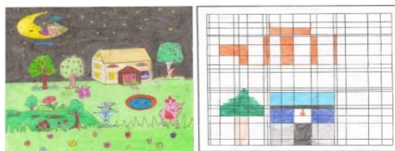
۴- نمونه تکمیل شده صفحه شطرنجی ۵- نمونه تکمیل شده نقاشی آزاد