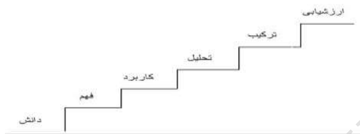
شکل ۱. سطوح مختلف حیطه شناختی

می‌رویم، حوزه فعالیت‌های شناختی عمیق‌تر می‌شود که این سطوح پلکانی، در شکل ۱ به تصویر کشیده شده است.