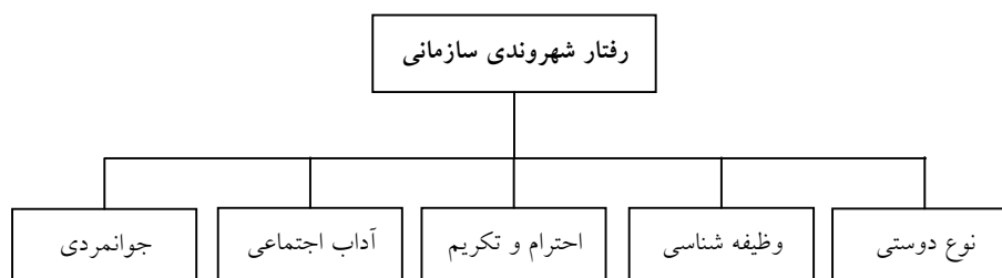
شکل ۱: الگوی رفتار شهروندی سازمانی

از قبیل حضور در فعالیتهای فوق برنامه و اضافی، آن هم زمانی که این حضور لازم نباشد. احترام و تکریم: شامل احترام به حقوق دیگران و مشورت با آنان است؛ این بعد بیان کننده چگونگی رفتار افراد با همکاران، سرپرستان و مخاطبان سازمان است.