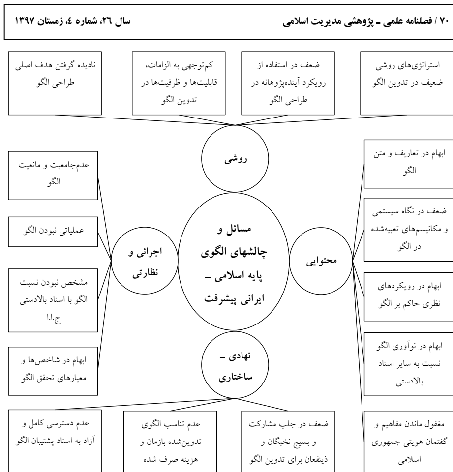
نمودار ۱: شبکه مضامین مسائل و چالش‌های الگوی پایه اسلامی ایرانی پیشرفت