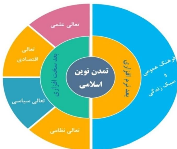
شکل ۳. ابعاد و مؤلفه‌های تمدن نوین اسلامی

مؤلفه‌های تمدن نوین اسلامی و الزامات شکل‌گیری آن بتواند درک درستی از این چشم‌انداز فراهم، و با ارائه چارچوب مشخص انطباق‌پذیری صحیح برنامه‌ریزی، هدفگذاری و بسیج منابع در مدیریت کلان کشور را آسان کند. براساس مضمونهای استخراج‌شده و با استناد به بیانات مطالعه شده به زعم نویسندگان این پژوهش، تمدن نوین اسلامی دارای دو بعد و پنج مؤلفه است. مقام معظم رهبری در بعد نرم‌افزاری، که از آن به بعد اساسی و متن تمدن نوین اسلامی یاد می‌کنند به مؤلفه‌های فرهنگ عمومی و سبک زندگی اسلامی تأکید می‌کنند. در بعد دوم یا همان بعد سخت‌افزاری، نظامات پیشرفته مطرح می‌شود و مؤلفه‌هایی همچون تعالی علمی، تعالی اقتصادی، تعالی سیاسی و تعالی نظامی (شکل شماره ۳).