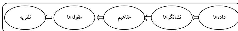
شکل ۱. الگوی فرایند اجرای نظریه پردازی داده‌بنیاد (استراوس، ۱۳۹۰؛ دانایی‌فرد، ۱۳۸۴).

در این تحقیق برای تحلیل داده‌ها از توان و ابزارهای مختلف روش «داده‌بنیاد» از قبیل شناسه گذاری باز، شناسه گذاری محوری و شناسه گذاری انتخابی استفاده شده است. فرایند کلی اجرای این روش در نگاره شماره ۱ نشان داده شده است.