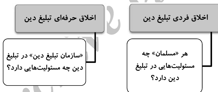
نمودار (۲) اقسام اخلاق تبلیغ دین

علاوه بر وظایف پیش‌گفته فردی، می‌توان اخلاقیاتی را متوجه نهاد و سازمانی ساخت که به‌عنوان یک شخصیت حقوقی عهده‌دار امر تبلیغ دین است. «سازمان تبلیغ دین» نام پیشنهادی نوشتار حاضر بر آن مجموعه است. سازمان تبلیغ دین، مجموعه افراد و امکانات سخت‌افزاری و نرم‌افزاری موجودی است که با کاربست آنها، امر تبلیغ دین، مدیریت و رهبری می‌شود.